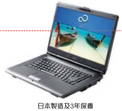
日本製造及3年保養