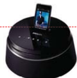
圖片只供參考, 不包括iPod