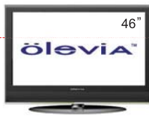
*需配合外置硬碟機及另外購買